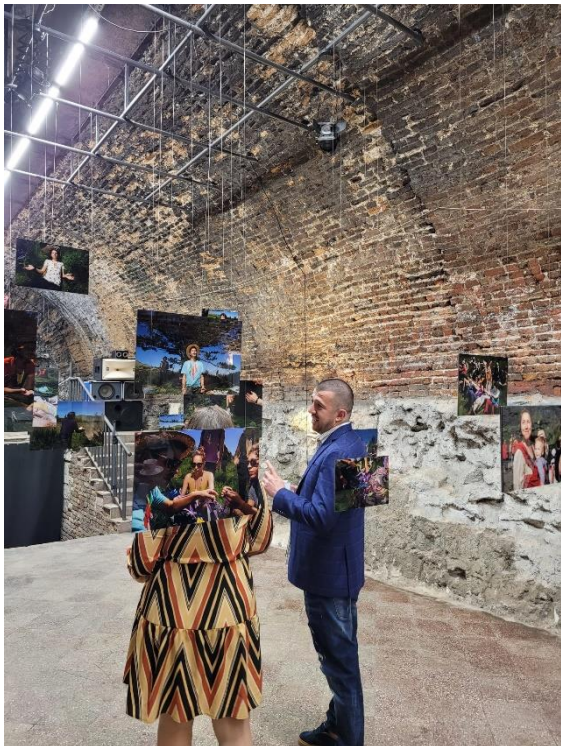
ReBonkers was ooit een kruitopslagplaats

Ottomaanse overheersing. De enigszins macabere expositie, met als thema "de dood", was perfect op haar plaats.