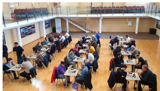
Uitzicht op de partijen

naar Varna, waar ze geweldig ontvangen werden. Na een moeizaam vertrek, omdat vanwege protestacties op vliegveld Eindhoven uitgeweken moest worden naar Maastricht Airport, werd het genieten in Varna. De gemeente Varna had kosten noch moeite bespaard om de schakers een geweldig weekend te bezorgen. Er werd genoten van een overheerlijke lunch, een stadwandeling, heerlijk eten in geweldige restaurants en een biertje aan het strand van Zwarte Zee en dat alles in combinatie met fraai voorjaarsweer.