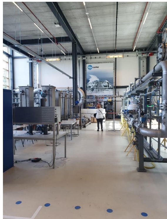
De duurzaamheidsfabriek maakt indruk

Op 30 en 31 mei bracht een onderwijs delegatie uit Varna een tegenbezoek aan Dordrecht. Directeuren van scholen en ambtenaren van de gemeente Varna namen een kijkje bij een aantal scholen en gingen in gesprek met de Dordtse ambtenaren en schooldirecteuren. Er werd een bezoek gebracht aan de Vrije School, IKS de Regenboog en aan de Duurzaamheidsfabriek op het Leerpark.